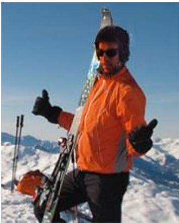
Piège n°3 : le désir de séduction