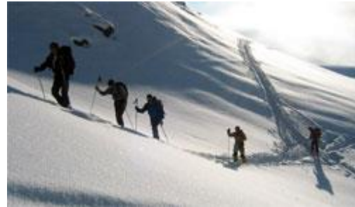
Piège n°4 : l'aura de l'expert

De la même façon, notre analyse a montré que les groupes mixtes ayant eu un accident avaient un score d'exposition plus élevé que les autres. Cette différence n'est pas due au fait que les femmes prennent plus de risques que les hommes : sur 1335 personnes impliquées dans des accidents d'avalanches, nous avons montré que les femmes avaient une probabilité plus faible d'être emportées. Il semble que les